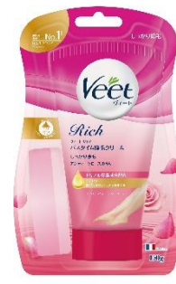
しっかり除毛 販売名：